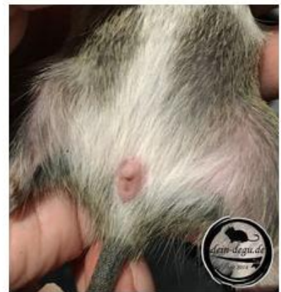
Weibchen (3 Wochen)