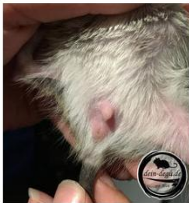
Männchen (3 Wochen) *schlecht gehalten*