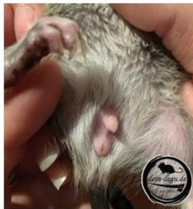
Selbes Männchen *richtig gehalten*